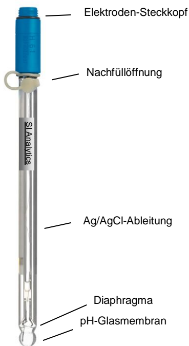
Abb.: N 61Eis