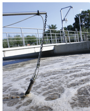
Ein IQ SENSOR NET-Sensor für gelösten Sauerstoff, der direkt im Belüftungsbecken zur kontinuierlichen Überwachung und Steuerung der Belüftung.

Die Chlorierung des Abwassers sorgt für die notwendige Desinfektion, um den aufnehmenden Fluss und die nachgeschalteten Nutzer zu schützen. Greg erklärt: "Ein bestimmtes Verhältnis von Ammonium zu Chlor muss beibehalten werden, damit dieser Prozess so effizient wie möglich funktioniert." Die Ammoniumkonzentration vor der Desinfektion wird mit dem ausgewählten Sensor überwacht. Der ermittelte Wert wird in das Leitsystem eingespeist und mit dem gewünschten Sollwert für die Ammoniumkonzentration verglichen.