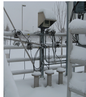
Das auf der Tankseite montierte IQ SENSOR NET 2020 XT-Terminal ermöglicht eine kontinuierliche Prozessüberwachung und -steuerung - auch unter rauen Bedingungen.

Die Kläranlage Littleton/Englewood wurde im Jahr 1977 als reine Belebtschlammanlage eröffnet und ist mittlerweile ist die drittgrößte öffentliche Kläranlage im Bundesstaat Colorado. Die Anlage nimmt die Abwässer von Littleton und Englewood sowie die von 21 weiteren kleineren Gemeinden im Versorgungsgebiet auf.