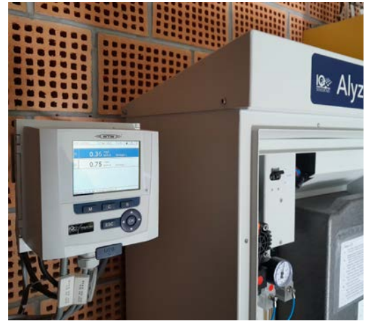
Abbildung 2: Alyza IQ \text{NH}_4 (2-Kanal) angeschossen an einen IQ SENSOR NET-Umformer DIQ/S 282-CR3