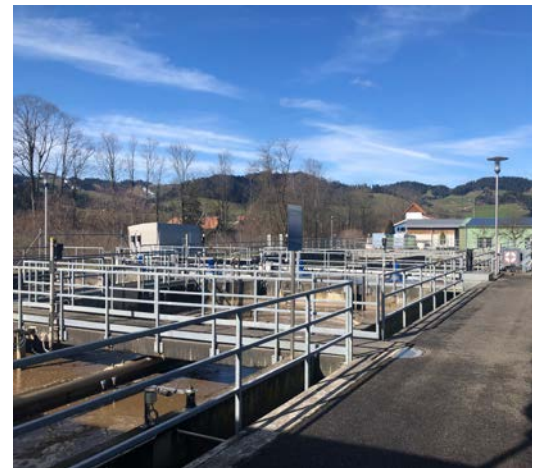
Abbildung 1: Blick über die Nitrifikation der Anlage

Aufgrund der Verweilzeit des Abwassers von mindestens vier Stunden in der Biologie, reicht das Messintervall aus, um selbst Zulaufspitzen abzubauen.