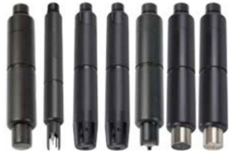
Abb. 2: Das Sortiment an korrosionsbeständigen Sensoren von Xylem.