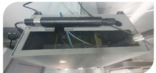
Abb. 3: Foto der tatsächlichen Bypass-Installation beim Kunden.