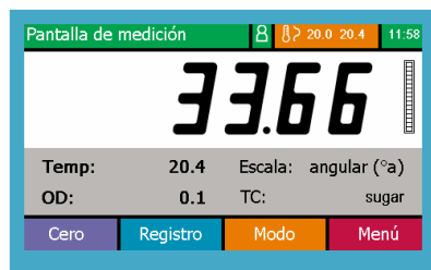
ADP400 que muestra parámetros de lectura a 20° C